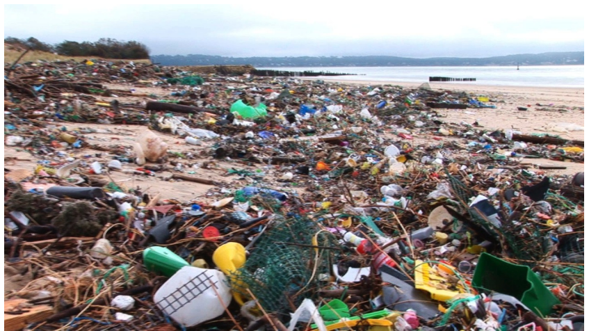
Plage du Cap-Ferret, Gironde Aquitaine, France 2014

Le nombre de déchets jetés dans la mer est de 20 milliards de tonnes par an. Environ 63% des objets jetés dans la mer sont des déchets solides, qui sont tombés ou jetés des bateaux. On ajoute à cela que chaque année des navires font naufrage et coulent au fond de la mer ce qui vient polluer l'eau marine.