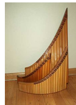
Flute de pan romaine