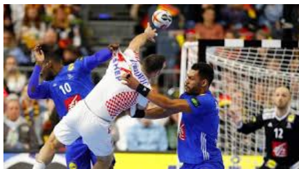
Mondial 2019 France face à la Croatie

Ce jeux se joue en sept contre sept avec cinq remplaçants. Un match se joue en 30 minutes avec deux mi-temps. Le gardien est le seul à pouvoir jouer dans la zone des buts et à avoir un maillot d'une couleur différente des autres joueurs de l'équipe. Il a aussi le droit de jouer hors de la surface des buts, mais il doit respecter les mêmes règles que les autres joueurs, en