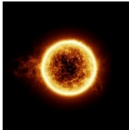
Le soleil

Les gaz et la poussière sont attirés par l'une de ces boules et