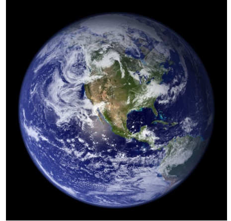
La terre

La distance entre le Soleil et la Terre est de 15 000 000 de kilomètres. Elle mesure 12 742 kilomètres de diamètre et sa population était de 7,53 milliards en 2017 et en 2019 presque 8 milliards. La Terre fait partie du système solaire de la voie lactée.