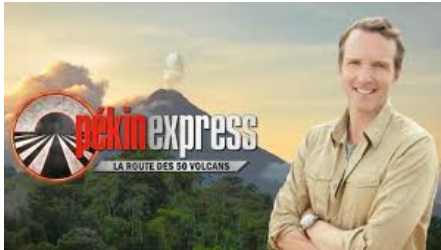
Pékin Express, Stéphane Rotenberg

Pékin express est une émission diffusée pour la première fois sur M6 en 2006 et présentée par Stéphane Rotenberg. Il s'agit d'une télé réalité où les candidats se « battent » dans une course effrénée pour gagner jusqu'à 100 000 euros !