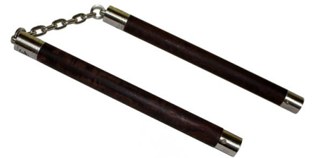
Le nunchaku