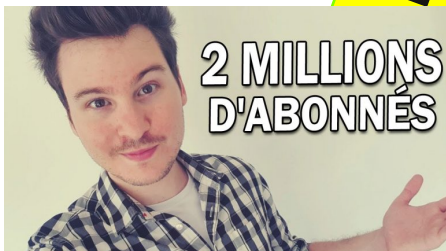
Furious Jumper

Découvrez les youtubers Furious Jumper et Siphano