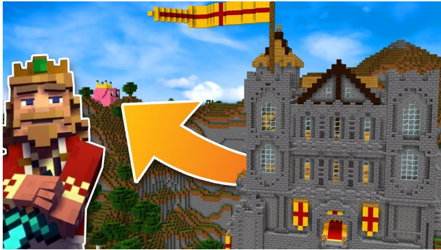
Fallen Kingdom, Minecraft

Il y a beaucoup de youtubeurs qui ont fait un Fallen Kingdom comme Siphano*, Frigiel*, SuperBrioche* ou Aurélien Sama*. Tout ce qu'il faut pour un Fallen Kingdom c'est du skill, des amis et une belle map Minecraft !