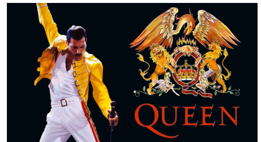
Freddie Mercury

En 1970 à Londres FREDDIE MERCURY forme le groupe Queen à l'âge de 24 ans