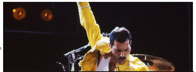
QUEEN - Freddie Mercury